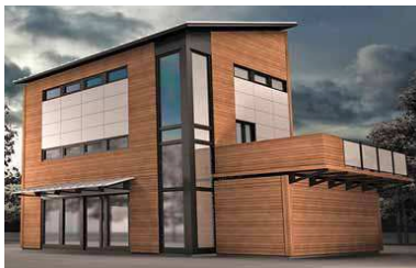
Une maison Bone Structure

Une fois le plan de la structure fixé, on passe à la fabrication des pièces d'acier. «Les pièces d'acier sont usinées sous licence par des entreprises qui fabriquent des pièces d'avion.» C'est dire la précision de ces dernières. Une fois les pièces usinées, elles sont transportées sur le terrain où elles seront assemblées. «Tout l'assemblage se fait avec un seul outil, soit une perceuse à percussion. Les portes et les fenêtres, même certains des revêtements extérieurs, se fixent à la structure d'acier selon un système d'attache. Il n'y a aucun clou.» Idem pour les cloisons intérieures.