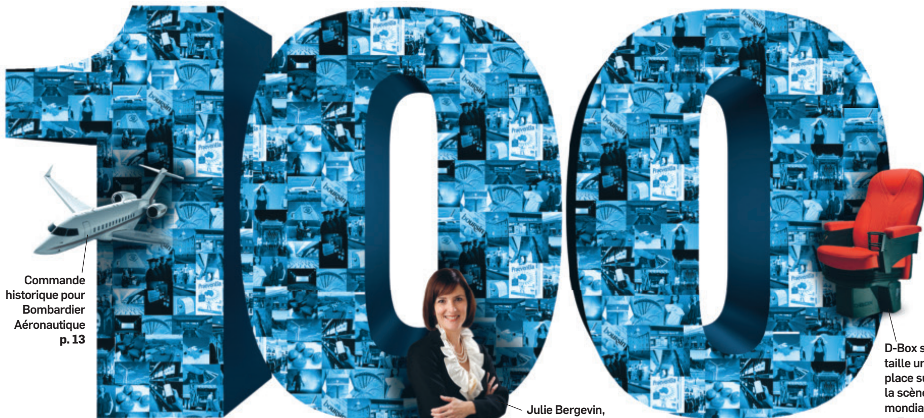
Commande historique pour Bombardier Aéronautique p. 13

« Que des entreprises disparaissent est non seulement normal, mais souhaitable » – Tim Harford, auteur et chroniqueur économique